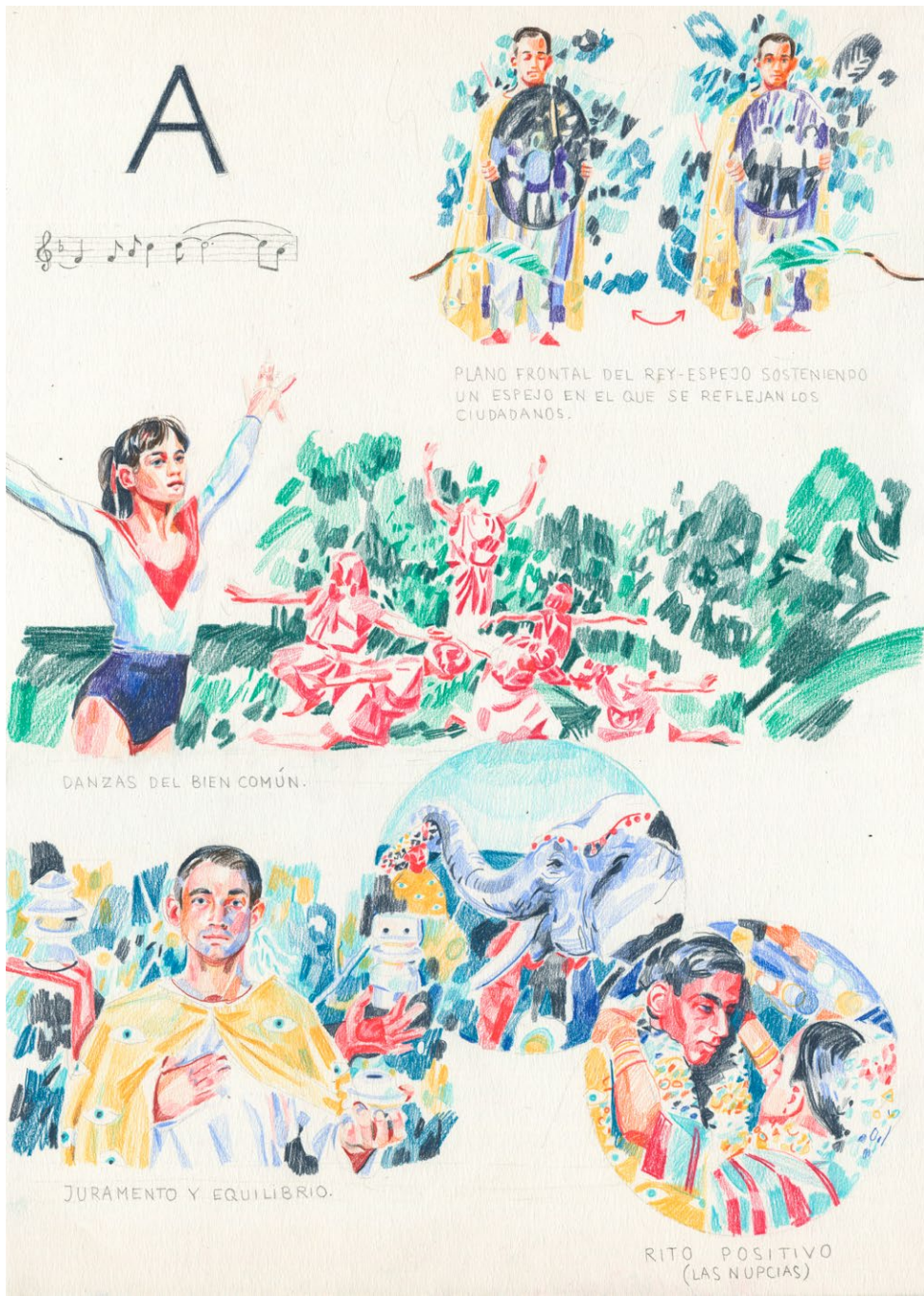
Storyboard ampliado para ACMÉ P.3, 2017 Pencil on paper. 35 x 25 cm