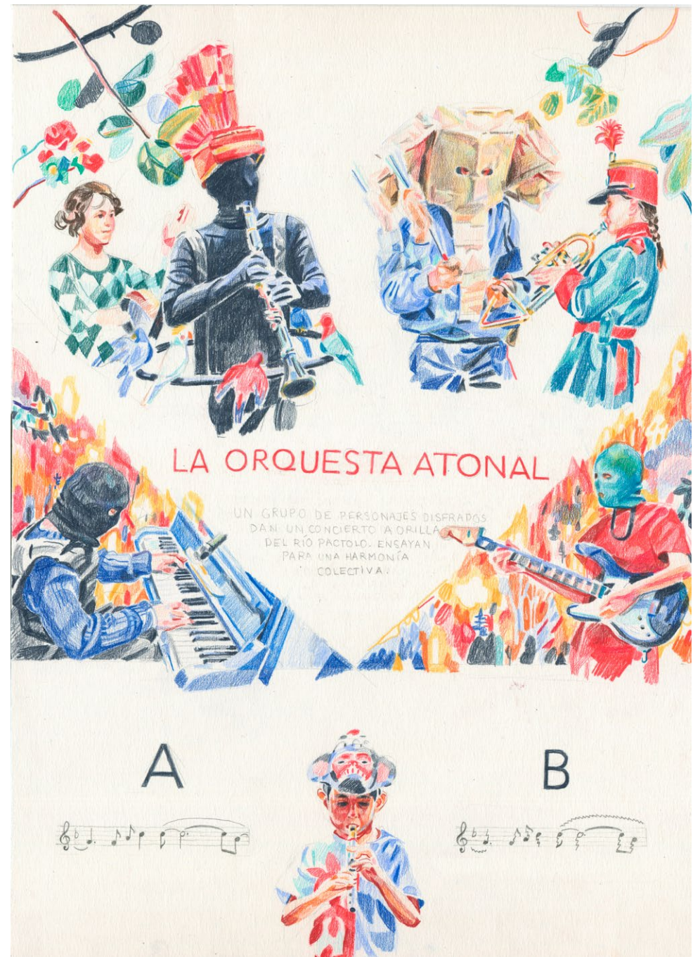
Storyboard ampliado para ACMÉ P.2, 2017 Pencil on paper. 35 x 25 cm