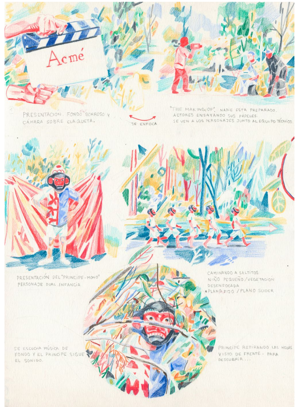
Storyboard ampliado para ACMÉ P.1, 2017 Pencil on paper. 35 x 25 cm